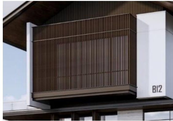
Gambar 5. Penerapan Wood Panel Composite (WPC) + Rangka besi Hollow dan plat besi.