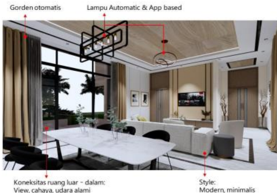
Gambar 3. Penerapan Teknologi pada Interior RTJM

Elemen-elemen ini menegaskan bahwa prinsip universalitas dalam desain interior rumah jabatan menteri tidak hanya mencerminkan tren arsitektur modern yang progresif, tetapi juga memperhatikan keberlanjutan, efisiensi energi, dan keseimbangan dengan lingkungan alami. Dengan mengadopsi strategi desain yang adaptif dan inovatif, rumah jabatan menteri di KIPP IKN dapat menjadi model hunian yang mendukung visi kota berkelanjutan di masa depan.