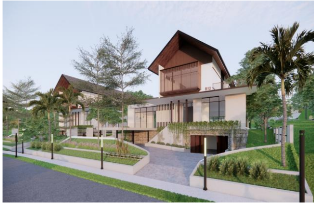
Gambar 4. Gaya arsitektur Rumah Tapak Jabatan Menteri di KIPP IKN