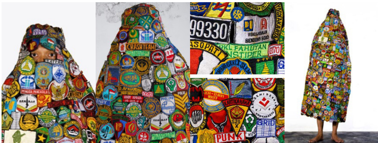
Gambar 5. Karya Mella Jaarsma, The Follower (2002)

Tubuh model mengenakan pakaian yang bentuknya seperti jubah kerudung yang tersusun dari lambang-lambang organisasi yang ada di masyarakat. Sepertinya, Mella Jaarsma ingin menceritakan kepada kita bahwa, di masyarakat Indonesia itu, berorganisasi dan kebersamaan merupakan hal yang biasa-biasa saja. Pada umumnya, identitas suatu organisasi itu terletak pada pakaian. Tapi, pada karya