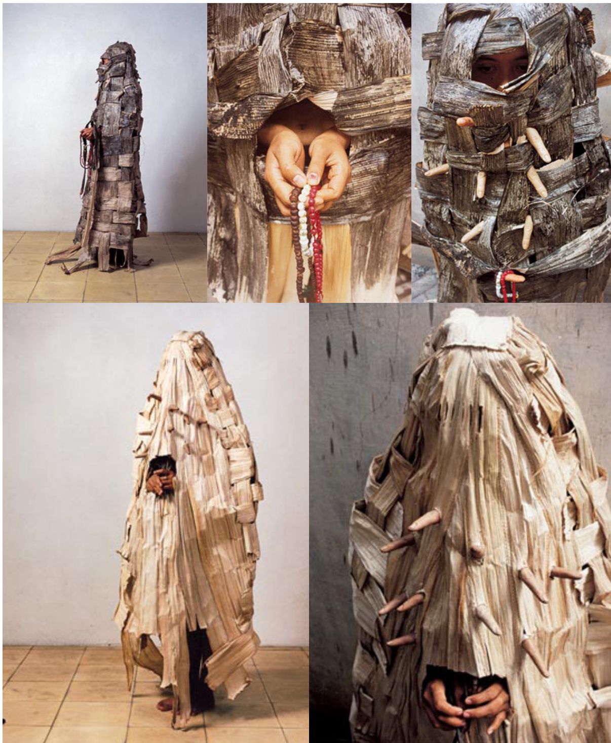
Gambar 4. Karya Mella Jaarsma, SARA-swati (2000)