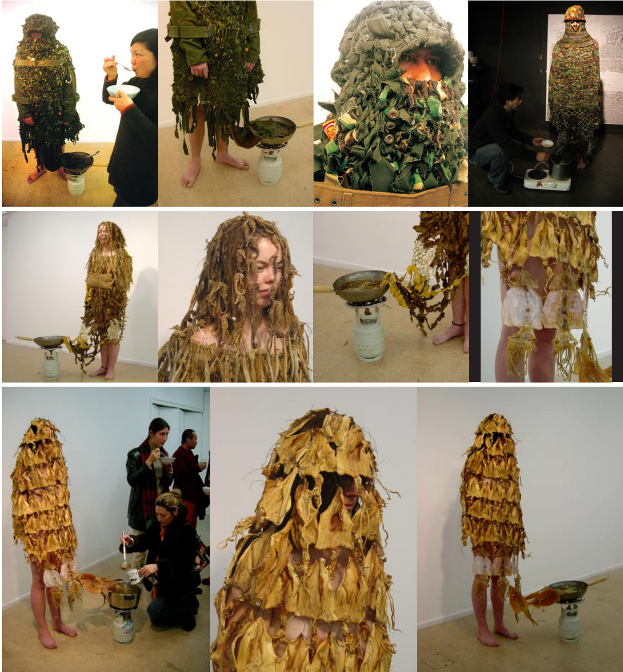
Gambar 8. Karya Mella Jaarsma, The Warrior, The Healer, The feeder (2003)