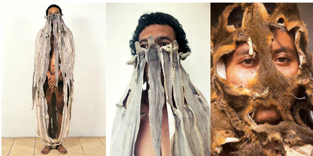
Gambar 3. Karya Mella Jaarsma, I Fry You 1 and 2 (2000)

Karya ini memilih konfigurasi yang khas dalam mengomunikasikan ide-ide. Mella Jaarsma melakukan upayanya mencari suatu bentuk bahasa rupa yang tidak terlalu berjarak dengan orang-orang yang melihat karyanya, dengan mempertemukan bentuk tubuh model sebagai idiom. Di sini penulis melihat dua hal sekaligus. Seseorang yang mengenakan pakaian untuk melindungi diri dari ancaman di luar dirinya. Di sisi lain, orang yang ada dalam pakaian itu juga telanjang sebagaimana adanya. Pakaian dan