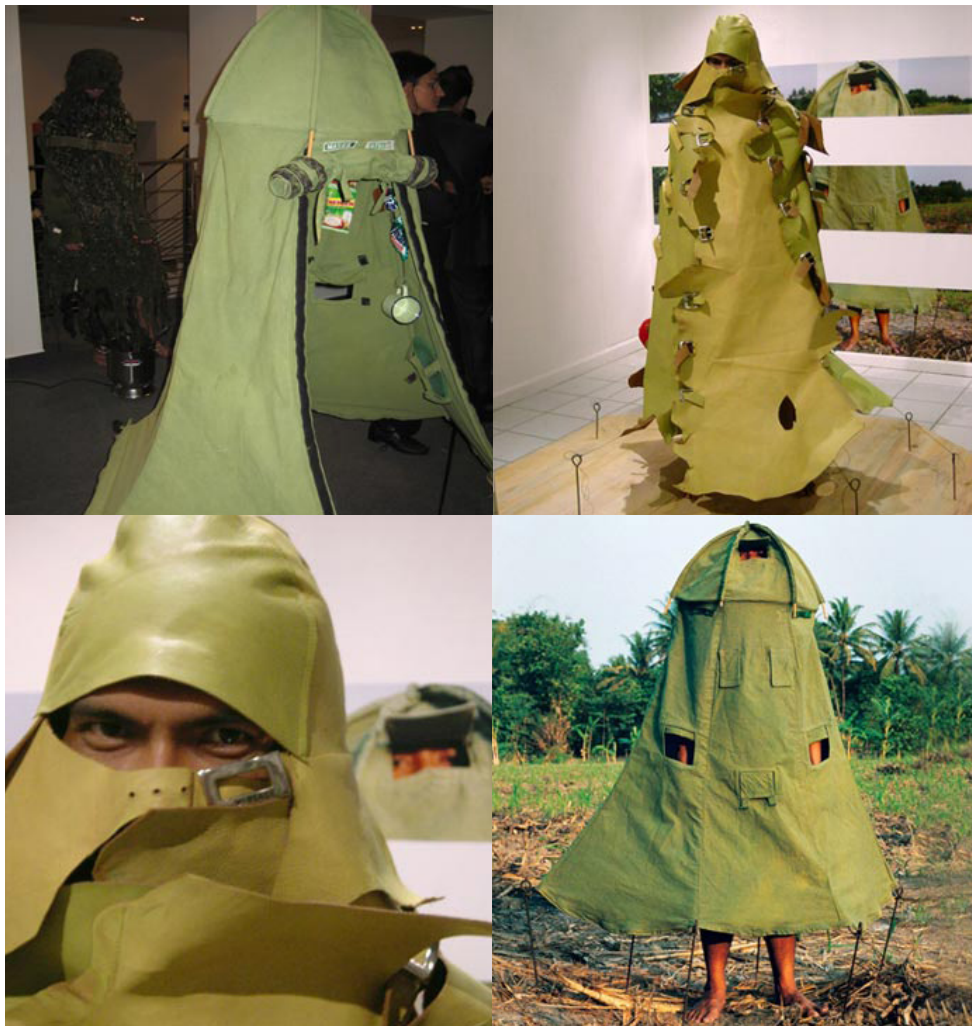
Gambar 6. Karya Mella Jaarsma, Refugee Only (2003)

Sehingga pilihan judul karya untuk mengganggu pemahaman kebiasaan kita melihat pengunjung dengan tenda. Sebab judul karya sama sekali tidak membantu penonton untuk memahami karyanya. Teknik ini merupakan gangguan yang memaksa kita untuk melihat karya seninya lebih lama dan memprovokasi kita sudah dimulai dari judul karya.