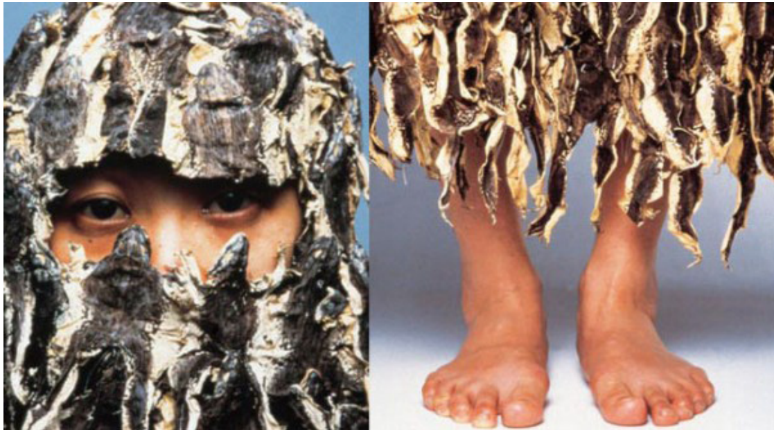
Gambar 2. Karya Mella Jaarsma, Hi Inlander (1998/ 1999)