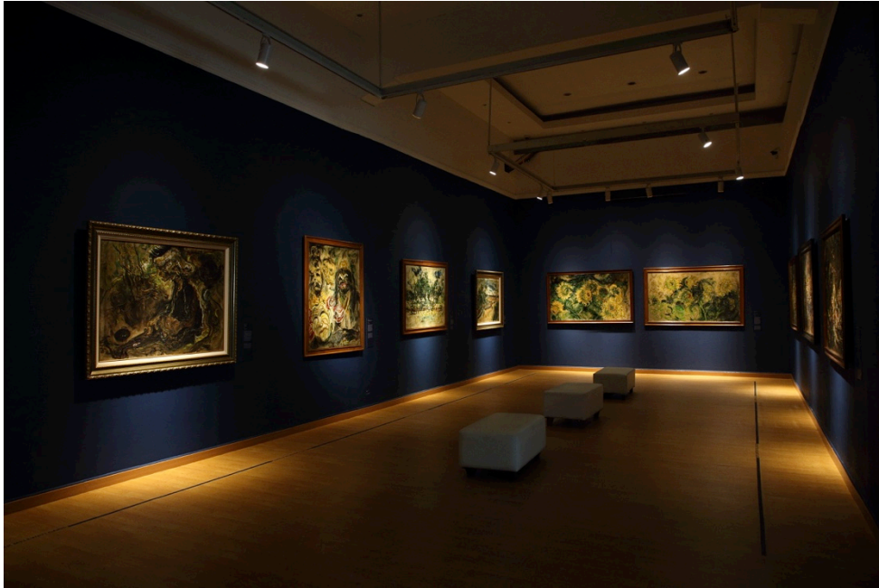
Gambar 6. Lukisan Affandi koleksi Galeri Nasional Indonesia yang turut dipamerkan