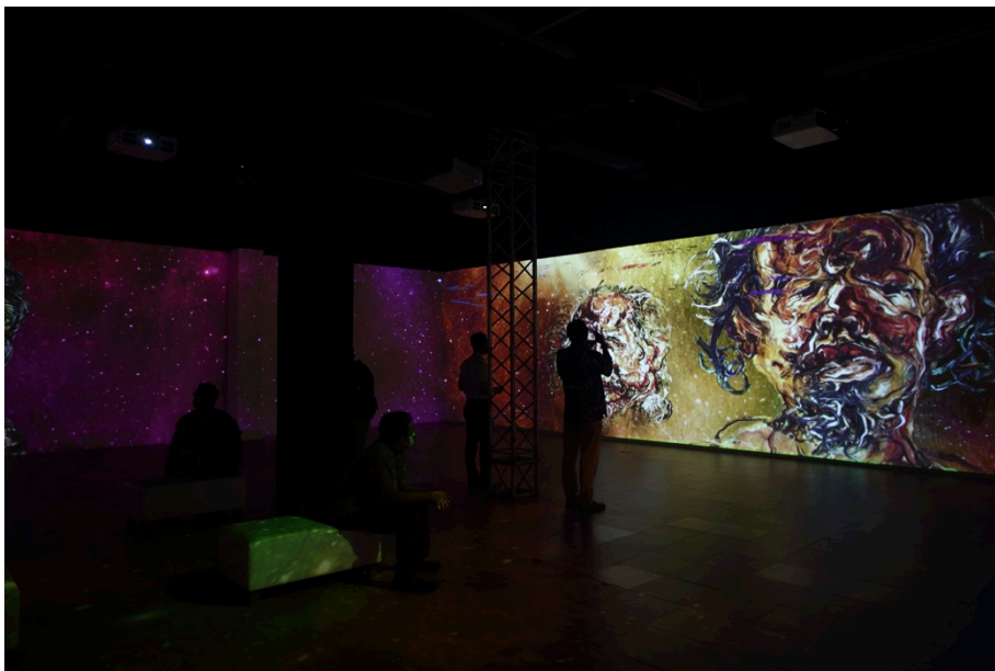
Gambar 5. Proyeksi video mapping pada dinding interior ruang pameran