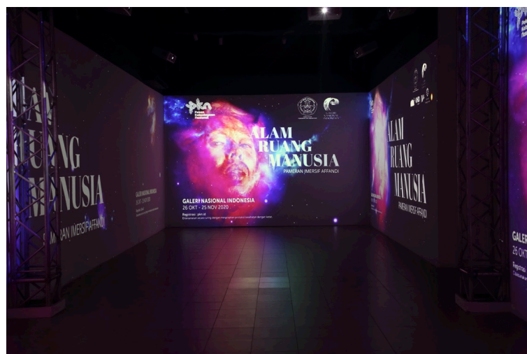
Gambar 3. Suasana ruangan pameran Imersif Affandi: Alam Ruang Manusia

Setelah beberapa saat terhenti sejak pandemi Covid-19, pameran temporer Galeri Nasional Indonesia (GNI) hadir kembali secara luring. Menjelang akhir Oktober 2020, GNI menyuguhkan sebuah pameran imersif berbasis video mapping projection yang mengangkat karya-karya dari salah satu maestro seni lukis Indonesia, Boerhanoedin Affandi Koesoema, yang dikenal sebagai Affandi. Pameran yang kajiannya dimulai sejak bulan Mei 2020 ini awalnya dipersiapkan dalam dua kemungkinan: presentasi lewat media daring, dan presentasi luring dengan kuota kunjungan yang terbatas.