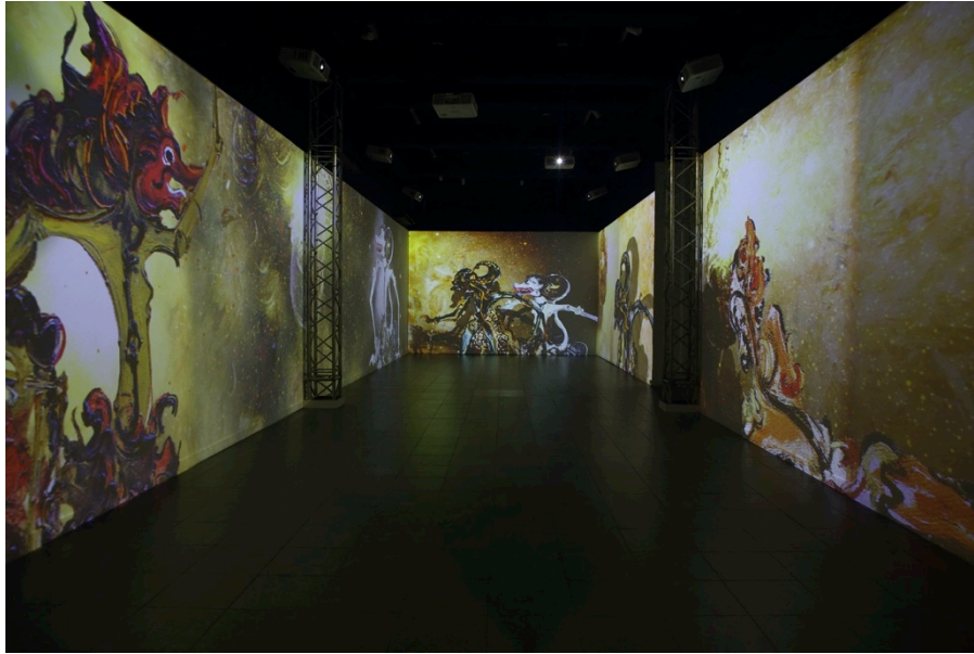
Gambar 4. Proyeksi video mapping pada dinding interior ruang pameran