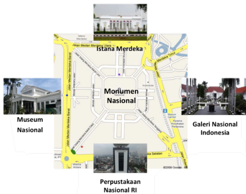
Gambar 1. State Cultural Institutions sebagai Landmark Bangsa Indonesia

Galeri Nasional ( National Art Gallery ) adalah sebuah lembaga khusus yang berfungsi sama seperti museum seni/art museum (umumnya nondepartemental) yang tercakup dalam Lembaga Kebudayaan Negara ( State Cultural Institutions ). Lembaga yang bertugas menangani bidang kebudayaan ini dibentuk dan didanai oleh negara atau sumber nonnegara lainnya dalam fungsi sebagai pengelola aset negara warisan budaya bidang seni rupa. State Cultural Institutions tersebut terdiri atas (1) Museum Nasional ( National Museum ), (2) Galeri Nasional ( National Gallery ), (3) Perpustakaan Nasional ( National Library ), dan (4) Pusat Konservasi Nasional ( National Conservation Center ). Keberadaan lembaga kebudayaan yang berdiri di pusat pemerintahan merupakan landmark sebuah bangsa yang modern. Demikian pula dengan Lembaga Kebudayaan Negara yang berada di pusat kota dengan Monumen Nasional sebagai titik pusat. Lembaga-lembaga tersebut menjalankan fungsinya sebagai basis penting dalam pengelolaan koleksi aset budaya yang merefleksikan nilai-nilai kebudayaan dan sejarah. Keberadaannya dapat menjamin aksesibilitas publik dalam memahami dan mengeksplorasi rangkaian sejarah perjalanan sebuah masyarakat dalam berbangsa dan berbudaya. (Gambar 1).