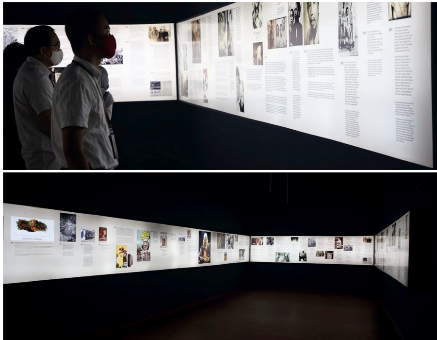
Gambar 7. Lini masa kronologi karir keseniman Affandi